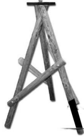
STOJAK DO KARMNIKA

OPIS TECHNICZNY: szerokość: 40 cm głębokość: 30 cm wysokość: 23 cm Materiał: sosna bejcowana, płyta; dach: papa.